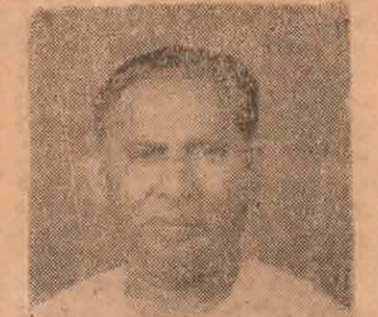
தமிழ் பேசும் மக்களின் சுதந்திரக் கோரிக்கை வலுப்பெற, இத்தேர்தலில் தமிழர் கூட்டணியின் ஆதரவில் தமிழரசுக் கட்சி வேட்பாளர்களை நிற்கும் எனவே ஆதரிப்பதைத் தவிர மன்னர் வாக்காளர்கள் முன்னுள்ள முடிவு வேறுக இருக்காது என்பது கட்டியினதும் எனதும் முழுத் தமிழ் பேசும் மக்களினதும் நம்பிக்கையான முடிவாகும்.

ஒரே குரலில் நமது சுதந்திர உரிமைக்கோரிக்கையை