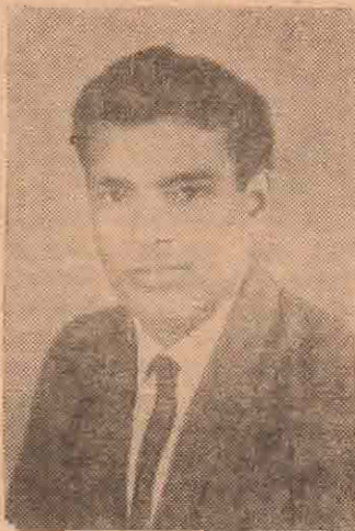
அவர்களுக்கொரு ஆறுதல் — தாங்கள் முடியாத துன்பத்திலும் ஓர் இன்பம்!

என்றாலும் — மக்கள் தொண்டில் ஈடுபட்டிருந்த போது தான் தன் மகன், மக்களுக்காக உயிரி கொடுத்தான் என்பதில்