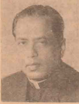
தமிழ் முனிவர் தனி நாயக அடிகள்.

—பார்த்து விட்டுக் கையை விரித்து விட்டார்கள் அவர்கள்!