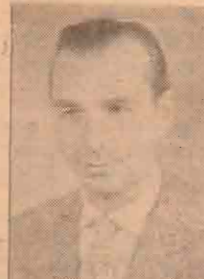
அனைத்துலகத் தமிழாராய்ச்சி மன்றத்தின் துணைத் தலைவர் ஜெனரல்.

மண்டபம் முழுவதும் மக்கள் தலைகீழ் மண்டபத்துக்கு வெளியேயும் மக்கள் தலைகீழ் எங்கும் எழுச்சிப்பேரலை எழுந்து கொண்டிருக்க காணப்பட்டது!