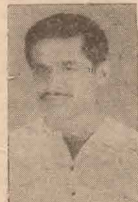
'தமிழ் ஏந்தல்' சமு வேந்தன்.

ஆனால் நம் இனத்தின் உயிருக்கு உயிரான—நம் வாழ்வின் ஒளிவிளக்கான—ஜீவசக்தியான—தமிழ்மொழிக்கு ஊறு செய்யவர்கள், யாராயிருந்தாலும் அவர்கள் தமிழ் சமுதாயத்தின் கோடரிக்காய்புகளே. தமிழ்மொழிக்கு பெருமையும் உயர்வும் கிடைப்பதை சகிக்க முடியாத மாற்றுகூடக் கை