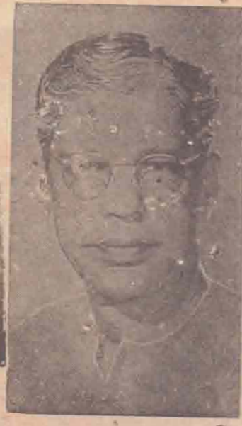
கி. ஆ. பெ. விசுவநாதம்

மொழியே நமது விழி. மொழியை இழந்தால் விழியை இழந்தவர்களா