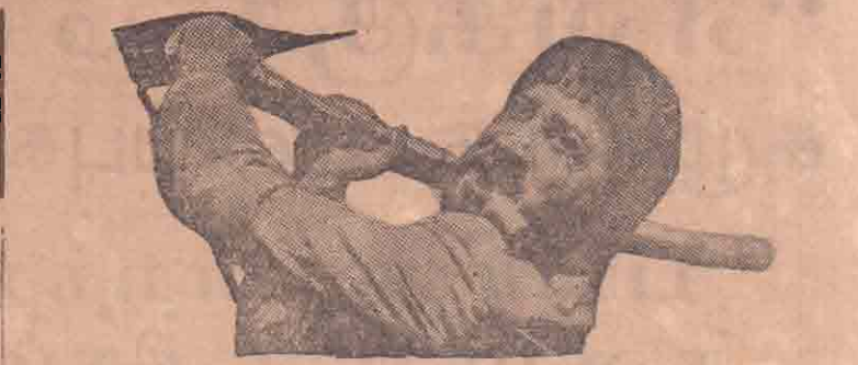
சிம்மக் குரலோன் சிவாஜி கணேசன் சினம் பொங்க சின எதிரிகளைத் தூள் தூளாக்கிறார். இங்காட்சிமையிலே என்டர் டெயின்மென்ஸ் திரைகளில் 2-வது மாதமாக வெற்றிக் கொடி நாட்டு 'இரத்தத் திலகத்' தில் காணலாம்.