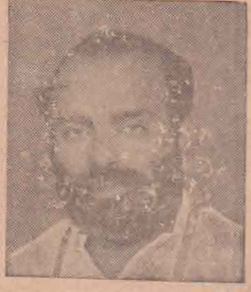
இங்கு விவாதிக்கப்படும் சட்டங்களைப்பிட்டு இருவகையான விவாதங்கள் இங்கு முன்வைக்கப்பட்டன. ஒன்று இப்பகுதியில் உள்ள உறுப்பினர்களையும், அரசாங்கத்தையும் அழகுக்குவது அடுத்தது தவறாக வழிநடத்தப்பட்ட வெளியிலுள்ள மக்களை அழகுக்குவது. தெவறுவரைப் பிதிநிதி அவர்கள் முன்வைத்த பகட்டான சட்ட பூர்வமான வாதங்களை ஆராய்வதற்கு இச்சபையின் பெரியோர்களுக்குச் சந்தர்ப்பத்தை ஏற்படுத்திக் கொடுத்துவிட்டு நான் விவாதிக்கக் கொள்கிறேன். ஆனால், மாக்கியவாதிகளாலும், சில சுதந்திரக்கட்சி உறுப்பினர்களாலும் அரசாங்கத்தையும் ஒழுங்கினைத்தையும் இந்த நாட்டில் ஏற்படுத்தவதற்காகச் செய்யப்பட்ட பிரச்சாரங்களைப் பற்றி விவையிலுள்ள மக்களுக்கு எடுத்துக் கூறுவது இந்த அரசாங்கத்தினதும்—எனதும் தவிர்க்க முடியாத கடமையாகும்.

ஆபத்தான வந்திருக்கிறதா என்பதைக் கவனிப்போம். இச்சபையிலுள்ள எந்தெந்தக் சுவாதீன மன்ற உறுப்பினரும் தமிழ் மொழி விசேட சரத்துக்கள் விதிக்களால் தமிழ் மொழி-சிங்கள மொழியுடன் சமத்துவ நிலையில் அரசாங்கமொழித்தகையமையைப் பெறுவதிலும் பார்க்க மிகமிகக்குறைந்த இடத்தை யே பெற்றிருக்கிறது என்பதை ஏற்றுக்கொள்வார்கள். தமிழ் மொழிக்கு உரிமை தந்ததுக் கொடுப்பதால் சிங்கள இனப்போ எத்தகைய இடப்பாட்டையும் அடைய மாட்டாத என்பதை வெளியில் உள்ள மக்களை உணரக் கூடியதாகச் செய்யவேண்டுமென்பது; தமிழ் மொழிக்கு உரிமை அந்தஸ்தை வழங்குவதன் மூலம் சிங்கள மொழிக்கு இடப்பாடு ஏற்பட மாட்டாது என்று நாம் விளக்கத் தேவையில்லை. இவர்களிடம் தான் சென்று சரோதரர்களை என்னை நம்புகிறீர்கள்! சில மாவட்டங்களில் தமிழ் மொழியைப் பயன்படுத்துவதன் மூலம் சிங்கள மொழிக்கு எத்தகைய உரிமை ஏற்பட மாட்டாது என்று கூறினால் அவர்கள் எனது கற்றை நம்ப மறுக்கலாம். ஆனால் எட்டிய யாந்தேட்டைப் பிரதிநிதி கொழும்பு மத்திய முக்குவது பிரதிநிதி போன்றவர்கள் இதைக் கூறினால் அவர்கள் நிச்சயமாக நம்புவார்கள்.