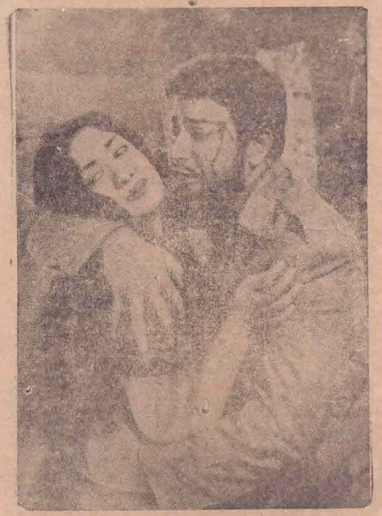
ஒட்டிமீரு உள்ளங்களை அன்னியன் குண்டிகான் வெட்டி விடுமா? நாட்டின் சுதந்திரத்தை காக்கும் பெரும் பணியில் ஈடுபட்டிருக்கம் சிவாஜியையும், சாவித்திரியையும், என்டர் டெயின்மெண்ட்ஸ் திரைகளில் ஓடிக்கொண்டிருக்கும் இரத்தத் திலகத்தில் காணலாம்.

ப: இலங்கையில் இருந்து வலுநீக்காரமாக ஒரு வரையும் நாடு கடத்தப் படாது அம்முடி தேசிய அரசாங்கம் ஒருவரையும் நாடு கடத்தாது என தாய்கள் நம்புகிறோம்.