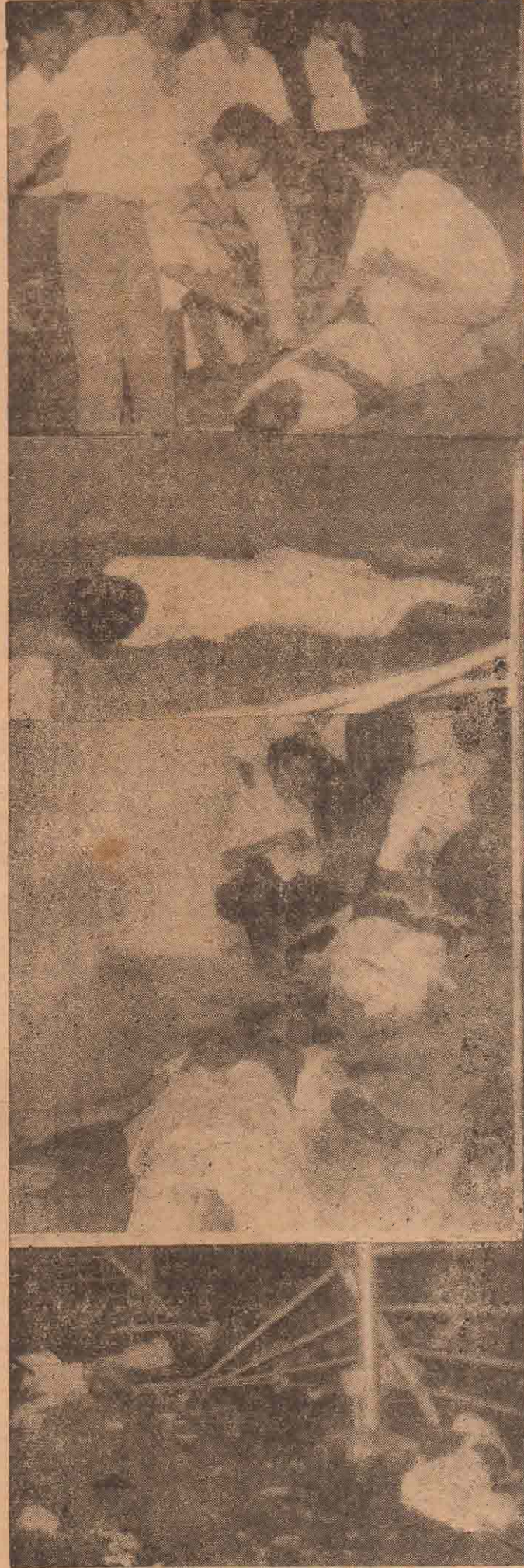
மேலேயுள்ள பரிதாபக் காட்சியைப் பாரடா தமிழ் மக்களே பார்!

கடந்த சனவரியில் நடைபெற்ற நான்காவது உலகத் தமிழ் மாநாட்டில் தமிழ் கேட்க அளவிலா ஆர்வமுடன் வந்திருந்த தமிழர்கள் தான் இவர்கள்! நாய்கள் போல அவர்கள் வீரசங்க மண்டபம் முன்னால் செத்துக் கிடந்திடும் பரிதாபத்தை பாரடா பார்!!