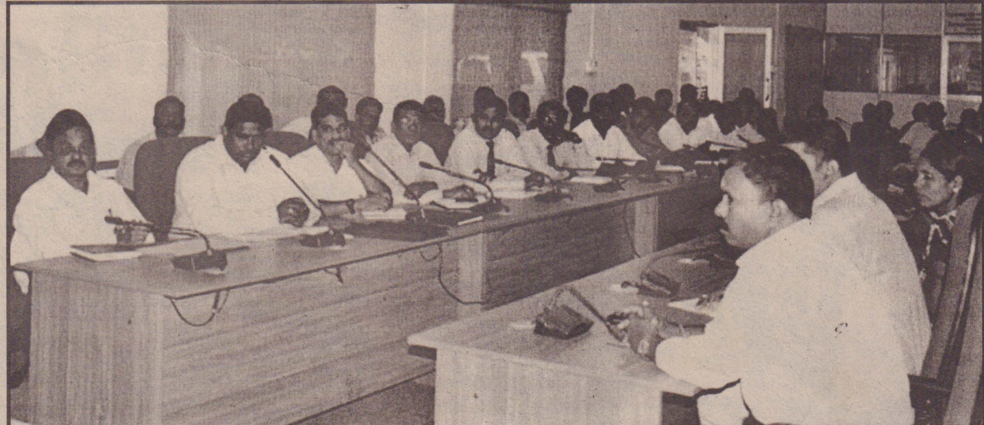
கிளிநொச்சி மாவட்ட இளைஞர், யுவதிகளுக்கு தொழில் வாய்ப்பை ஏற்படுத்திக் கொடுக்கவும் தொழிற்பயிற்சிகள் தொடர்பில் ஆராயவும் ஓசூர் தொழில் சிறுவசைத்தொழில் அபிவிருத்தி தொடர்பான கலந்துரையாடல் அண்மையில் கிளி. மாவட்ட செயலகத்தில் இடம்பெற்றபோது, மேலும்: றொப்பாளர் செய்தியாளர்

மேலும் நாட்டின் உண்மையான நிலைமைகள் குறித்து அந்தந்த நாடுகளுக்கு தெளிவுபடுத்துமாறு வெளிநாடுகளுக்கான இலங்கைத் தூதரக அதிகாரிகளுக்கும் அறிவுறுத்தல் விடுக்கப்பட்டுள்ளது. (அ-2)