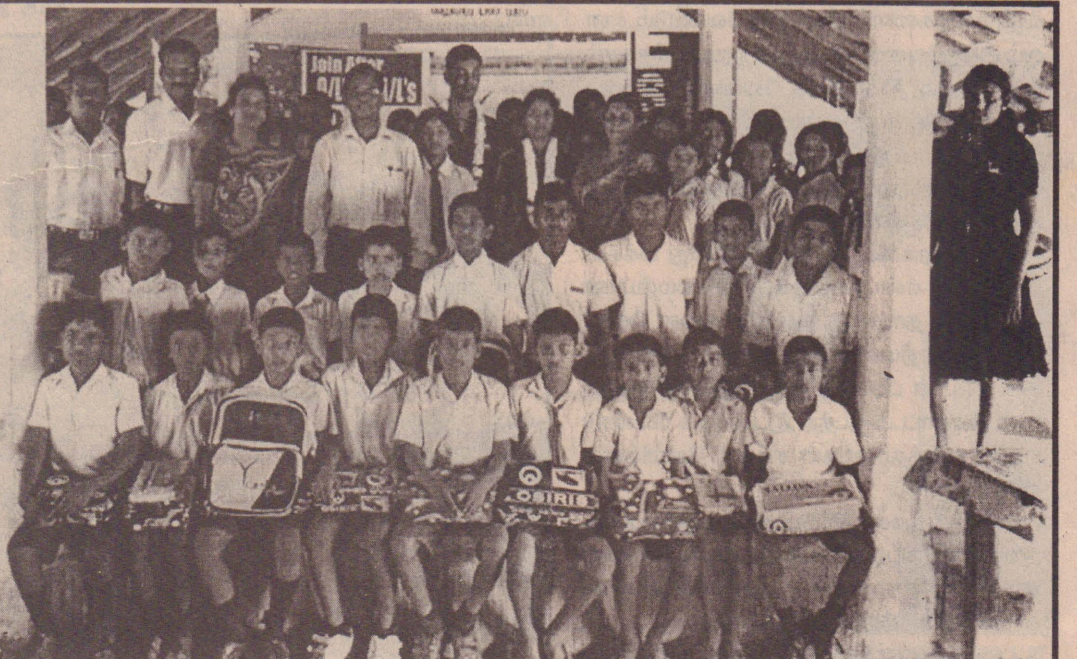
E-Soft நிறுவனத்தின் அனுசரணையுடன் யாழ்ப்பாணம் பல்கலைக்கழகம் வித்தியாசாலைக்கு கற்றல் உதவிய் பொருட்கள் வழங்கும் நிகழ்வு அண்மையில் இடம்பெற்றது. இதன்போது மாணவர்களுக்கு உதவியாக பொருட்கள் வழங்கும் நிகழ்வு அண்மையில் இடம்பெற்றது. இந் நிகழ்வில் மாணவர்களுக்கான உதவிய் பொருட்கள் வழங்கப்படுவதையும் உதவிகள் பெற்ற மாணவர்களையும் படங்களில் காணலாம்.