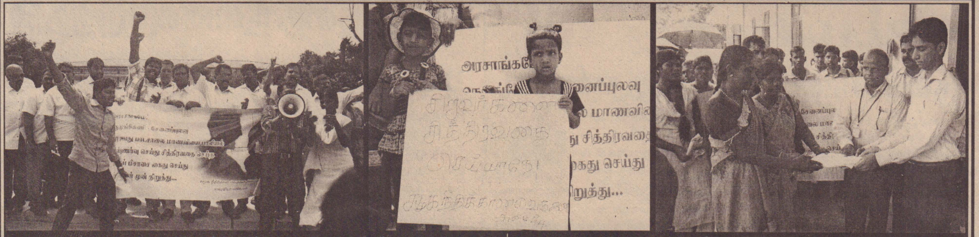
வவுனியா நெடுங்கேணி சேனப்பிலவில் 7 வயது சிறுமி பாலியல் வன்புணர்வுக்குள்ளாக்கப்பட்டமையை கண்டித்து சிறுமிக்கு நீதி வழங்கக் கோரியும் குற்றவாளியை கைது செய்யுமாறும் சமூக நீதிக்கான வெகுஜன அமைப்புகள் ஏற்பாடு செய்திருந்த ஆர்ப்பாட்டத்தின் போது... (டபங்கள்:- பூந்தோட்டச் செய்தியாளர்)