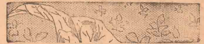
சி. சி. சி. புகையிலை பசளைக் கலவைகள்

(1-ம் பக்கத் தொடர்ச்சி) போராடும் எந்தக் கட்சியும் இருக்காது, அவர்களை அடக்கி ஒடுக்கி அடிமைகளாக்குவது எளிதாகிவிடும் என்பதுதான் ஆளும் கட்சியின் வஞ்சகத் திட்டம்.