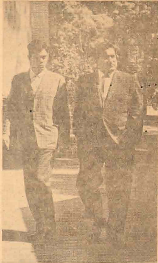
அமெரிக்கத் தேரு ஒன்றின் அழகிய நண்பர் ஒருவருள் சேர்ந்து நடந்து பகுதிக்குள் சென்றார் கணேசன்.

அமெரிக்காவிற்குச் சென்று ஹொலிவுட்டில் சுற்றுப் பிரயாணம் செய்து வர பாலச்சந்தர் விரைவில் செல்கிறார்.