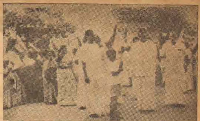
அதிகாலையிலேயே தொண்டர்கள் புறப்பட ஆயத்தமாகிவிடுகின்றனர். தளபதி அமிர்தலிங்கத்தின் புதல்வன் தானே தளபதி போலி முன் செல்ல முத்திவிடுகிறார். கையில் முவர்க்கை கொடியுடன் புறப்பட ஆயத்தமாகிவிட்டான்.

தமிழராக அபிமானி, இராமநாதபுரம் கே: இதுவரை தமிழரின் நிலை பற்றிக் கொம்புநிலைகளும், சமயமாறிகளும் கவனமெடுக்கவில்லையே! ஆனால் தமிழராகக் கட்டி திட்டத்தைத் தீட்டி அதின் பின் குறை கூறுவதின் காரணமென்ன?