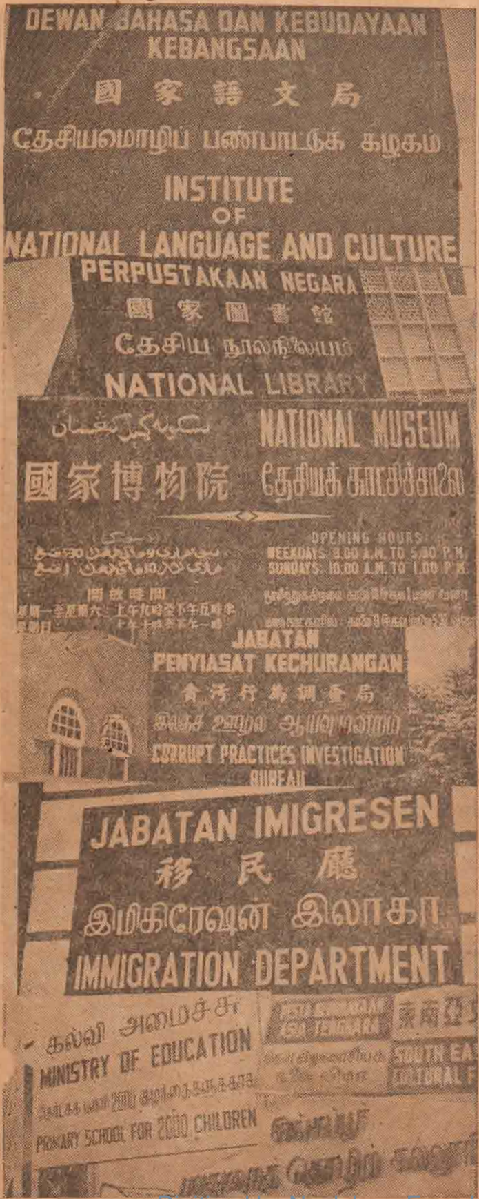
சின்னஞ்சிறிய சிங்கை தேசிய அறிவிப்புப் பலகைகளில் வெல்லாம் தமிழ் இடம் பெற்றுள்ளதைப் பாருங்கள்.

சிங்கையிலுள்ள அறிவிப்புப் பலகைகளில் தெள்ளு தமிழ் கொஞ்சுவதை எங்கும் காணலாம். பிரிட்டிஷ் காலனித்துவ காலத்திலும் தமிழுக்கு ஓரளவு இடமளித்திருந்தார்கள். ஆனால் அந்த நாளைய மணிப்பிரவாள அறிவிப்புகளுக்கும் இப்போதைய விளக்கங்களுக்கும் எத்தனை வேற்றுமை! ஓர் அலுவலக வாசலில் No Admittance. என்று ஆங்கிலத்தில் ஓர் அறிவிப்பு இருக்குமானால் தமிழில் "உட்பிரவேசிக்காத" என்று தந்திருப்பார்கள் காலனித்துவ நாளில். இன்றோ 'அலுவல் இருந்தால் மட்டும் உள்ளே வருக' என்று அழகாக, இட