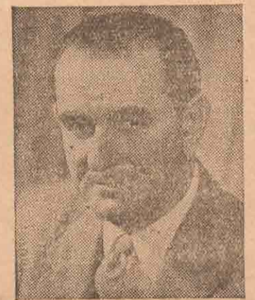
புதிய ஜனாதிபதி லின்டன் பி. ஜோன்ஸன்

இவர் 1935ம் ஆண்டு தொடக்கம் அரசியலில் ஈடுபட்டு வந்துள்ளார். 1937ல் சனப்பிரதிநிதிகள் சபைக்கு அவர் தேர்ந்தெடுக்கப்பட்டார்.