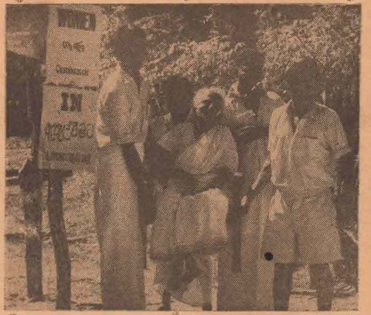
தள்ளாத வயதிலும் தாம் வாக்களிப்பு நிலையத்துக்குச் சென்று தமது உரிமையை நிலநாட்டப் பிடிவாதம் செய்த தமிழ் மூதாட்டியைத் தமிழரசுத் தொண்டர்கள் நாற்காலியில் இருத்தித் தூக்கிச் செல்கிறார்கள் "உயிர் போகும்வரை விட்டுக்கு ஓட்டலுக்கும் என் உரிமையை விட்டுக் கொடேன்" என்று பொக்கை வாயால் முழங்கிய இம் மூதாட்டி தமிழரசுத் தந்தையின் காங்கேசன்துறைத் தொகுதியைச் சேர்ந்தவராவார்.

பிட்ட குழந்தை தனக்குப் பிறக்கவில்லை என்று வழக்காடுபவர் ஒருவர்; தன் மனைவி நடத்தை தவறியவள் என்பது அவருடைய கட்சி இது ஒரு சிக்கலான வழக்கு. நீதிபதி சட்டத்தைத் துணைக்கொண்டபடி பயனேதும் இல்லை; அதற்கு மாறாக அவர் அறிவியலின் துணையை நாடுகிறார். அதன் மூலம் உண்மையை அறிந்து தீர்ப்பளி்கிறார்.