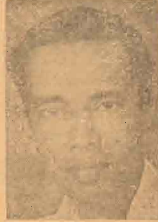
திரு வி. ராவிக்கவாசு (தமிழரசு) 7,605 திரு எஸ். சிவலாசம் (சுயேச்சை) 5,295 அதிகப்படியானவை 2,810 பட்டிக்குப்பு