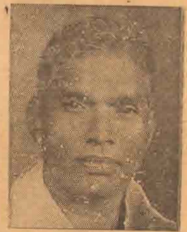
திரு ஏ. சிவசுந்தரம் (தமிழரசு) 5,338 திரு வி. அனந்தசங்கரி (சமசமாஜக் கட்சி) 2,011 அதிகப்படியானவை 3,327