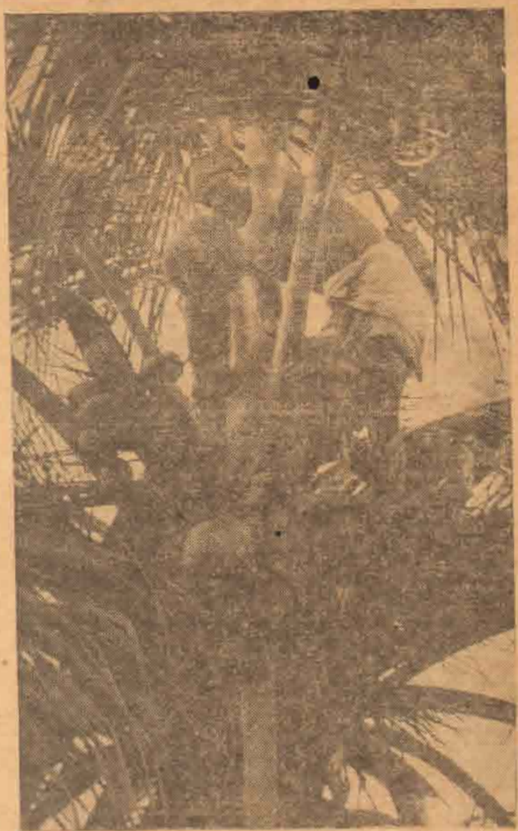
பாளை தட்டிப் பின்னர் கட்டி அழுவும் சீனி குட்டியும் கட்டி பாடி விட்டது.

"என்ட பேரா? அப்போதே சொன்னேனே செல்வப்பா என்று அப்பாட பேர் கதிர்ன். எனக்கு வயது நாப்பத்தஞ்சிதான். என்னை மரம் மரம் ஒரு ரெண்டு, பொம்புடையன்