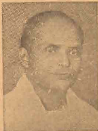
திரு. எஸ். எம். இராசபாணிகம் (தமிழரசு) 10,948 திரு. எஸ். யு. எதிர்மன்னசிங்கம் (தமிழ் காங்கிரஸ்) 5,283 திரு. ச. பொன்னையா (சுயேச்சை) 247 அதிகப்படியானவை 5,665 கோப்பாய்