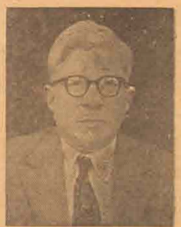
திரு வி. அழகியேன் (தமிழரசு) 7,307 ஜனாப எஸ். எச். மொகமட் (யு. என். பி) 5,790 அதிகப்படியானவை 1,517 உடுவில்