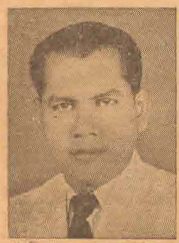
ஜனாபம் எம். ஐ. எம். அரம்பம் மஜித் (த. அ. ஆதரவாளர்) 12,115 ஜனாபம் எம். ஏ. எம். ஜலால் நீன் (கமேட்சை) 4,339 அதிகப்படியானவை 7,776

சேட் முதலியார் ஜனாபம் எம். என். காரியப்பர் (அ. இ. இ. முன்னணி) 5,661 அதிகப்படியானவை 1,955 நிதர்சு