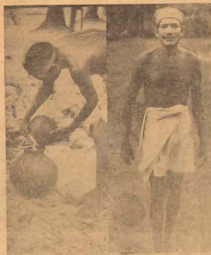
இரப்பைகள் நுழைந்த வற்றையிலேதையும் தொழிலாளிகள் அங்குசத் தயாராகக் செய்வதையும் தீங்கே காணலாம்.

ஒரு கிடு வென்று செல்வப்பா இறங்கிவிட்டார். அந்த உயர்ந்த மரத்திலே அவர் கறந்த பால் முட்டியிலே நெரு நெருத்தது நம்பிக்கையில்லாவிட்டாலும் தனிவாக இன்னுமொரு 'கனிக்' அப்படி திரும்பினேன்.