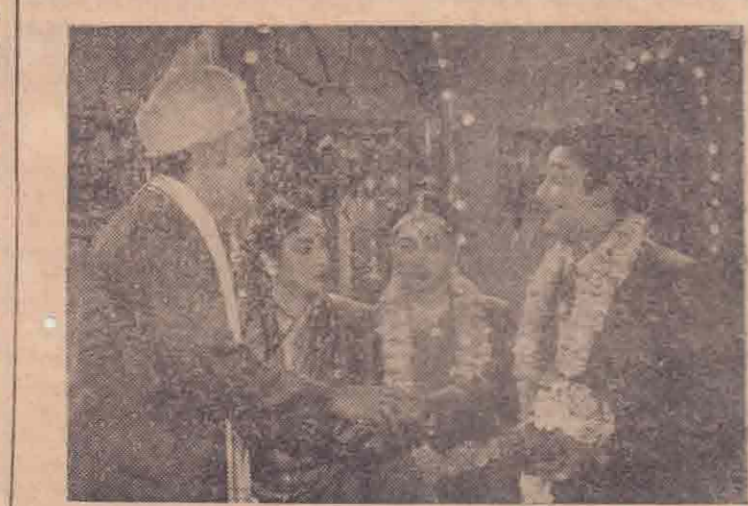
சிவாஜியைக் கணவனாக அடைந்தும் ஜமுனா ஏன் கண்கலங்க வேண்டும்? ‘பொம்மை கல்யாணம்’ பதில் கூறுகிறது.