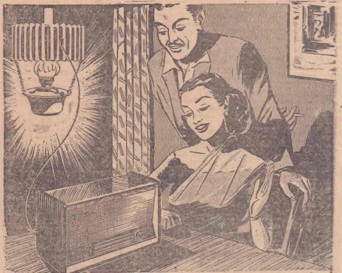
பீப்பிள்ஸ் ரேடியோ (விளக்குடன்) மண்ணெண்ணெயில் இயங்குவது

இந்த அதி அற்புத பீப்பிள்ஸ் (மண்ணெண்ணெய்) ரேடியோ பற்றி மேலும் விபரம் வேண்டுவோர் எழுதிப் பெற்றுக் கொள்ளலாம். நேரில் வந்தும் தெரிந்து கொள்ளலாம்.