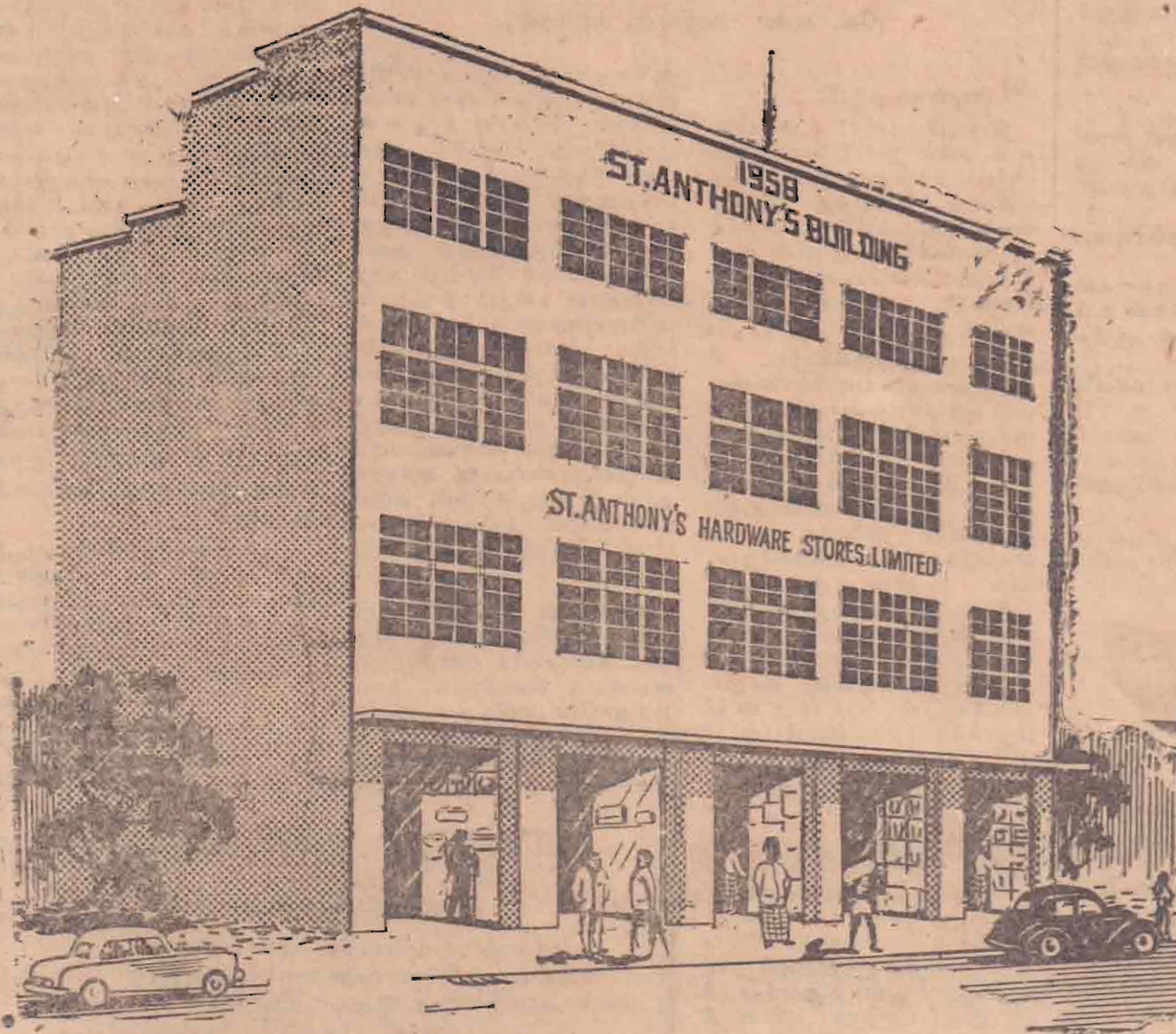
சென்ற அந்தனிஸ் ஹார்ட்வேயர் ஸ்டோர்ஸ் புத்தம் புதிய கட்டத்தின் எர்லிமிகு முகப்புத் தேற்றம்

ரேடியோ வைத்திருக்க. விரும்பும் அனைவருக்கும் அரியதொர் சந்தர்ப்பம். பட்டணக் காரராயிருந்தாலும் சரி, கிராமவாசியாக இருந்தாலும் சரி மின்சாரம் இல்லாத குறையால் ரேடியோ வைக்க முடியவில்லையே என்று கவலைப்பட வேண்டியதில்லை. பாட்டரி ரேடியோ வாங்குவதானால் மாதாமாதம் பாட்டரிக்கு பணம் எண்ணிக் கொடுக்க எங்கேபோவது என்றும் ஏங்க வேண்டியதில்லை.