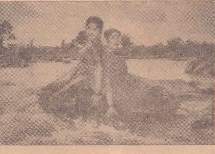
குளத்திலே தாமரை மலர்வதன்னை, சலசல என்ற சத்தம் உடன் ஓடும் அருவியிலே மலர்ந்திருக்கின்றன இரு மலர்கள் அழகு முகங்கடும் இவ்வெயில் மலர்கள் 'பாத காணிக் கைக்கூக' இயற்றிய ஊனத்திருக்கின்றன.