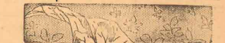
சி. சி. சி. புகையிலை பசுளைக் கலவைகள்

(நோம். 6-45 ஆகி விட்டது. தொடர்ந்து கேள்வி கேட்டாலும் கெனமன் மறுப்பு வார்த்தைகள் ஊர்ஜிதமாகி விட்டது. ஆகவே தமிழ் மாணவர் அத்துடன் நிறுத்திக் கொண்டார்.