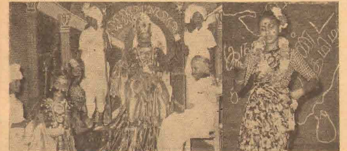
நீர்சொல்லும் விவேகாநந்தா வித்தியாலயத்தில் நடைபெற்ற பெற்றோர் இவ்வாறான போது மாணவிகளால் நடித்துக் காட்டப்பட்ட "விரத்திரமகள்" நாடகத்தில் ஒரு காட்சி. அடுத்தபடி; ஒரு மாணவி குறத்தி நடனம் ஆடுகின்றார்.

உடலைக் காட்டி ஊதியம் பெற விடும்பாத மன்றோ, நடிப்பு மூலம் தனது உள்ளத்துக்கு அதிகமான முக்கியத்துவம் அளிக்க விரும்பினார். "புகழ் இன்று இருக்கும்; நாளை போகும். அதைப் பற்றி எனக்கு அக்கறையில்லை. நான் படங்களில் 'நடிக்க' விரும்புகிறேன். என்னை மக்கள் உண்மையான நடிக்கை எனப் புகழ வேண்டும்" என்று அவர் வெளியிட்டுள்ள கருத்துக்கள் அவரது உள்ளக்கிடக்கை என்ன வென்பதை எடுத்துக் காட்டுகின்றன.