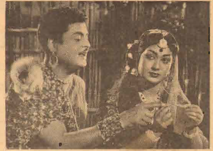
"சுருத்தை எங்கே செலுத்துகின்றாய் காரியமே?" என்று கணேஷன் கேட்டும், கண்பார்வையை நமக்கவிடும் சாவித்திரியைப் "பார்த்தால் பரிதூரம்" அல்லவா?