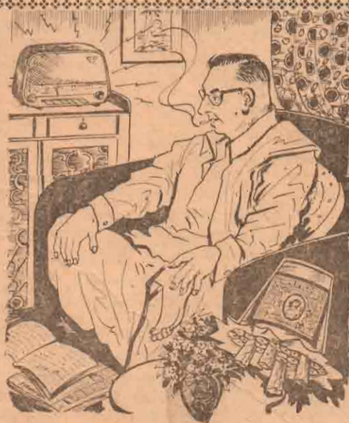
பணக்காரன் முதல் எல்லோரும் புகைப்பது

ப: தமிழரசுக் கட்சியை மலை நாட்டுத் தமிழர்கள் ஆதரிக்கும்போது எதிர்ப்புகளெல்லாம் எம்மட்டு? வளர்ச்சிக்கு எதிர்ப்பும் தேவைதானே!