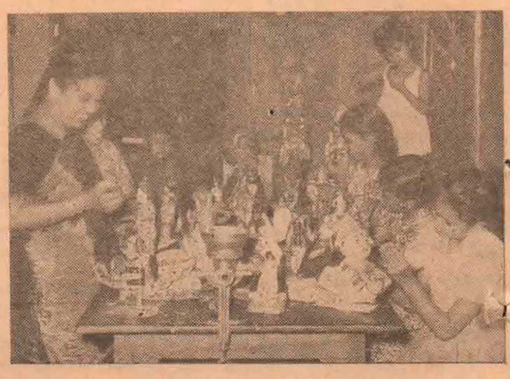
நவராத்திரி என்றதும் சிறுவர்களுக்கு ஒரே குதூகலம் தான்! பொம்மைக் கொலு வைக்க ஆவலோடு எதிர்பார்ப்பார்கள். மேலேயுள்ள படத்திலும், குழந்தைகள் பொம்மைகளுக்கு வர்ணம் பூசுவதில் அக்கறையுடன் ஈடுபட்டிருப்பதை பாருங்கள். —படப் பிடிப்பு: கிங்ஸ்லி செல்வையா

13 அடி நீளம், 10 அடி அகலம், 10 அடி உயரமுள்ள அறையொன்றினுள் இருக்கும் காற்றின் நிறை 100 ருத்தல்களாகும்.