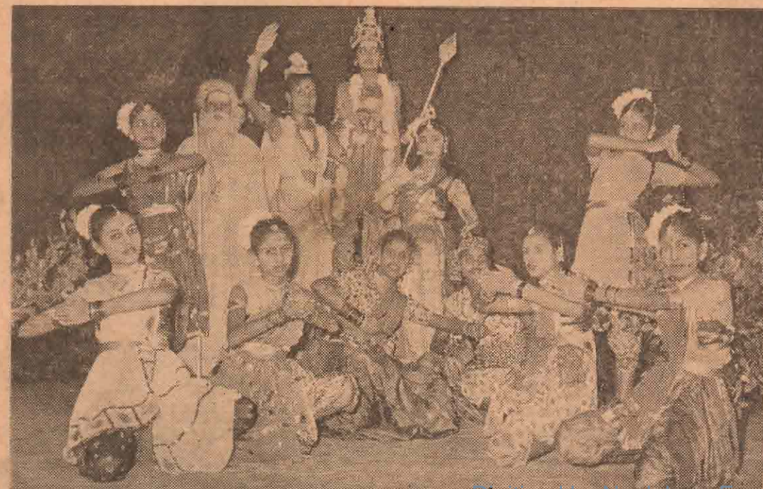
மட்டக்களப்பு விந்ஸன்ட் உயர்தரக் கல்லூரி வருடாந்த விழாவில் நடைபெற்ற "வள்ளி திருமணம்" நாட்டிய நாடகத்தில் ஒரு காட்சி.