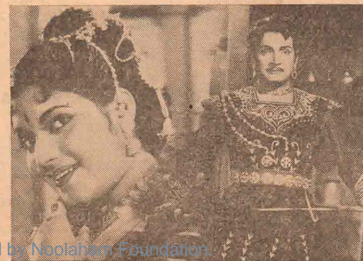
சினிமாஸ் திரைகளுக்கு வரும் "நாக நந்தினி"யில் தேவிகாவும், நம்பியாரும் இப்படிக்காட்சி தருகின்றனர்.