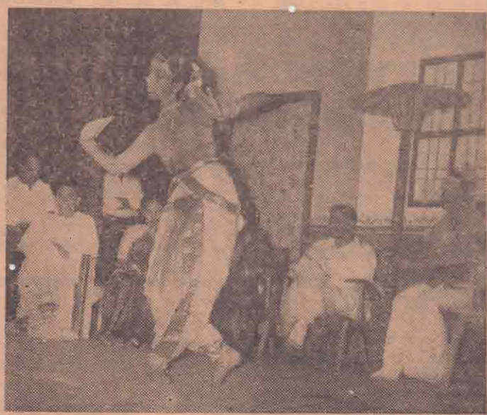
‘கலியாணத் தரகன்’ நாடகத்தில் ஒரு கட்டம்