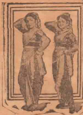
ஆடல் அரிவையரும் காதுல் லோடியும். ‘பிரசிடென்ட் பஞ்சாட்சரம்’ என்ற படத்தில்.

தலை முடியை சீவுவதல்ல உங்கள் பிரச்சனை! நீங்கள் விரும்புவதுபோல் தலை முடியைச் சீவுவது எப்படி என்பதுதான்!