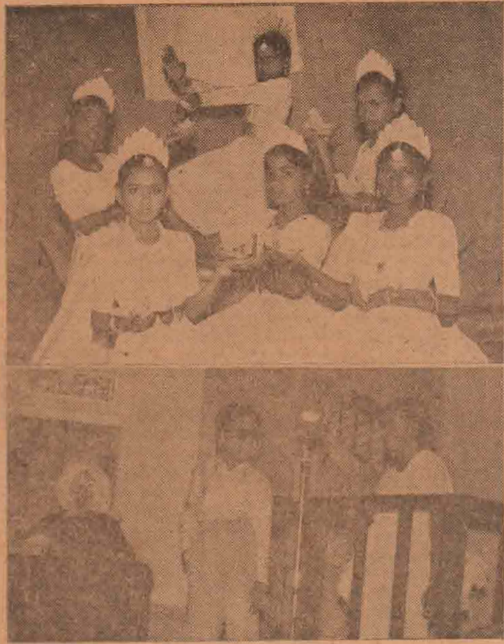
கொழும்பு ஐக்கிய சகாய சேவா இலவச கலவன் இராப்பாட சாலை மாணவர்கள் சமீபத்தில் கொழும்பு கமலா மோடி மண்டபத்தில் ஒரு கலை நிகழ்ச்சி நடத்தினார்கள். அந்தக் கலை நிகழ்ச்சியில் இரண்டு காட்சிகள் மேலே வெளியிடப்பட்டுள்ளன. (1) தாமரைப் பூ நடனம் (2) "கீக்கிரட்டைஸ்" நகைச்சுவை நாடகம். (செய்தி 5-ம் பக்கத்தில்)