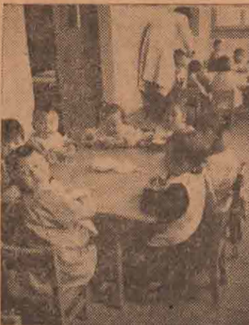
இடம்: தொழிலாளர் குழந்தைகள் பராமரிப்பு நிலையத்தில் சில குழந்தைகள். வலம்: மறைந்த டயர் சன்-யாட்-சன் இல்லத்தின் முன்புறத் தோற்றம். இரண்டும் ஷாங்கையில் உள்ளன.

நாம் சென்றிருந்தன்று தான் டிராக்டருக்கான டயர் உற்பத்தி தொடங்கியது.