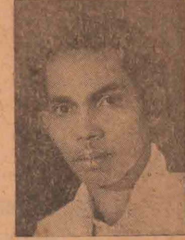
திரு. அ. ஆ. சுமணதாஸ் கமலா மொடி மண்டபத்தில் நடைபெற்றது. (படம் 12-ம் பக்கம்)

முத்தமிழ் வளர்க்க இயக்கம் இன்றைய இலங்கையில் தமிழ் மொழி அரசாங்க மொழிகளுள் ஒன்றாக இருக்கக்கூடாது. தமிழக்குச் சம அந்தஸ்து அளிக்கக்கூடாது