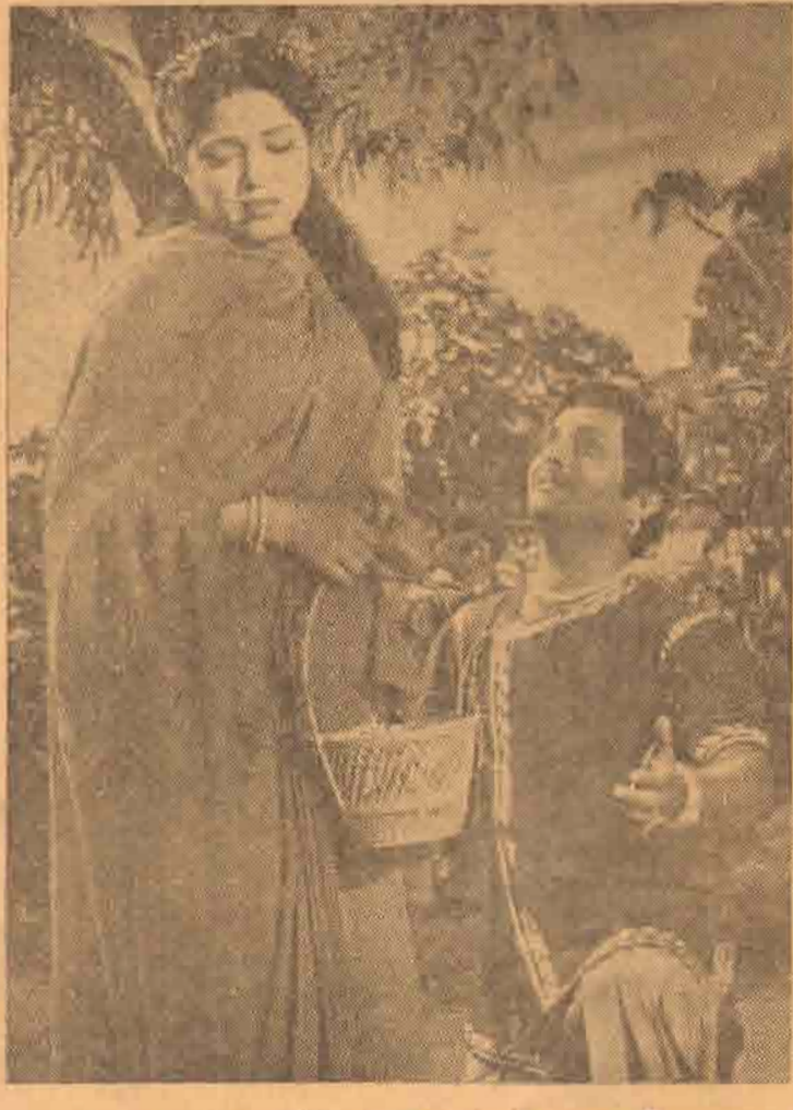
கடந்த காலத்தை நினைத்துக் கலங்குகிறார்கள் இருவரும். பாஜமதியின் காலடியில் மகாலிங்கம்! மணிமேகலை யடத்தில் வருகிறது இந்தக் கட்டம்.

படத்தில் கேட்கும் சிவாலியின் சிம்மக் குரல் இசைத்தட்டுகளில் இல்லை. 'சிவாலியின்' தான் கேட்கிறது. படம் முழுவதையும் ஆறு இசைத்தட்டுகளில் அடக்கவேண்டும் என்பதற்காக 'ராக்கேட்' வேகத்தில் பேச்சும் பாட்டும் வரும்படியாக இசைத்தட்டுகளில் ஒலியைப் பதிவு செய்திருக்கிறார்கள். அது தான் போகட்டும். படத்து உரை யாடலாவது தொடர்ச்சி சிதைவுறாமல் போகுத்த மறந்து இசைத் தட்டில் பதிவு செய்யப்பட்டிருக்கிறதா? கிடையாது. ஆங்கொன்றும் இங்கொன்றுமாகப் பொறுக்கப்பட்ட வசனங்களைக் கேட்டால் ஒன்றும் புரிவதாயில்லை. நல்ல வசனங்கள் பலவற்றை கேட்கவே முடியவில்லை. பாட்டுகளிலும் படுகொலை