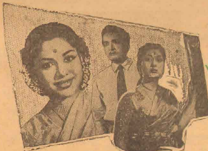
பின்னணி: கண்டசாலா — திருச்சி லோகநாதன் — ஜமுராணி — சுசீலா.

முருகன் ஓடியன் ராணி லிபர்ட்டி (ஜிந்துப்பிட்டி) (கல்கிசை) (யாழ்ப்பாணம்) (பதுளை)