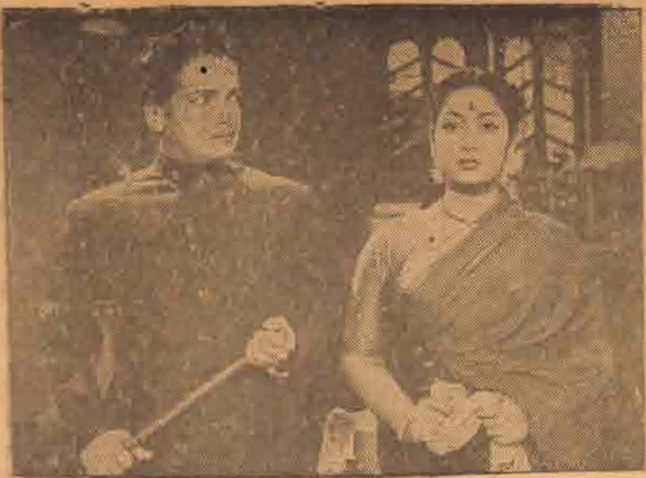
விஷயம் சரியல். இனிச் சிந்தித்துப் பயனில்லை. 'பாக்கிய தேவதை' படத்தில் நடிப்பாரும் எலித்திரியும்.