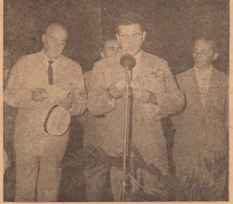
போலந்துப் பிரதமர் சிரங்கோவிச் தாம் சொல்ல விருப்பியதைத் தமது தாய் மொழியில் வாசிக்க, அதன் ஆங்கில மொழி பெயர்ப்பை ஒலிவாகுகி பூன்னால் நிற்கும் அவருடைய மொழி பெயர்ப்பாளர் படித்துக் காண்பிக்கிறார்.

போலந்துப் பிரதமர் தமது தாய் மொழியிலேயே பேசினார். ஒவ்வொரு சொல்லையும் அவர் பேசி வாய் (9-ம் பக்கம் பார்க்க)