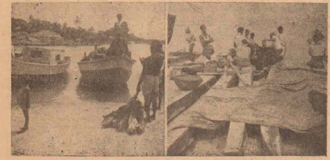
நீர்கொழும்புக் கடற்கரையில் காணப்படும் காட்சிகளான இவை இரண்டும் சர்வசாதாரணமானவை

ஆபத்து "ஆகாயத்தில் அந்தரத்திலே பறக்கும் விமான இயந்திரம் பழுது பட்டால் விமானிகட்கு எத்தகைய ஆபத்து உண்டாகுமோ அதைப் போலவே கொந்த