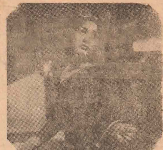
சோகக்கட்டத்தில் நடப்பதில் சாவித்திரியை யாரும் மிஞ்சமுடியாது என்பதை அண்ணாவின் ஆசையில் மீண்டும் நிரூபிக்கிறார்.

யும்படி தணிக்கையாளர் உத்தரவிட்டுள்ளார். முக்தா பிலிம்ஸ், 'தேன்மழை'யென்னும் படத்தில் கே. ஆர். விஜயாவும், குமாரி சச்சுவும் இதழ்களோடு இதழ்கள் பதிக்கும் ஆபாசக் காட்சியையும், கே. ஆர். விஜயாவின் மார்பின் மீது ஜெயினிகளைச் சின் தலை படுகின்ற காட்சியையும் சுத்தரித்து விடும்படியும் உத்தரவிடப்பட்டுள்ளது.