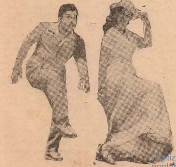
'அன்மேவா' படத்தில் புரட்சி நடிகரும் கன்னடத்துப் பைக் கிளியும் இப்படி ஆட்டம் போடுகிறார்கள்.

'பிரைட்ரோஸ்' என்ற பெயருடைய ஐப்பான் தயாரிப்பு புரான் கிஸ்டர் ஒன்று பிரசன்னாவிடம் இருக்கிறது. அதன் அமைப்பு 'குளோப்' போல இருக்கும். அதை பிரசன்னா கையில் எடுத்துக்கொண்டால், படப்பிடிப்புக்குப் புறப்படும் கொண்டிருக்கிறார் என்று அர்த்தம். படப்பிடிப்புக்குப் புறப்படும் போது எதை மறந்தாலும் மறக்காவிட்டாலும், இந்த டிரான்சிஸ்ட்-ரை மட்டும் மறக்க மாட்டார் பிரசன்னா.