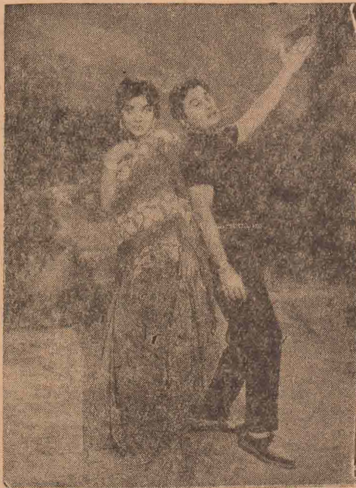
'தாய்க்குத் தலைமகளில்' எம். ஜி. ஆர்.—ஜெயலலிதா