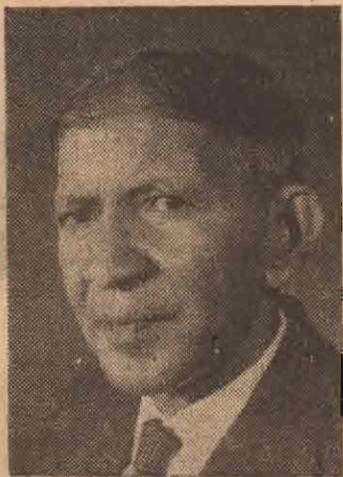
அவர் மேலும் கூறிய கருத்து--

டாக்டர் ஹுசைனுக்கு கிடைத்த மகத்தான வெற்றி ஜனநாயகத்துக்கு கிடைத்த ஒரு மகத்தான வெற்றியாகும். ஜனநாயகம் நல்லமுறையில்