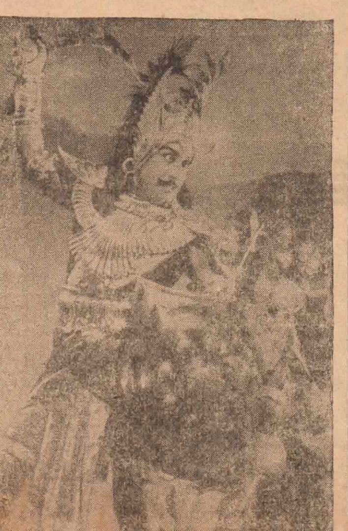
திரையுலகினால், சுதந்திரன் 501 பதிப்பகம், த. பெ. இல. 1153, கொழும்பு.