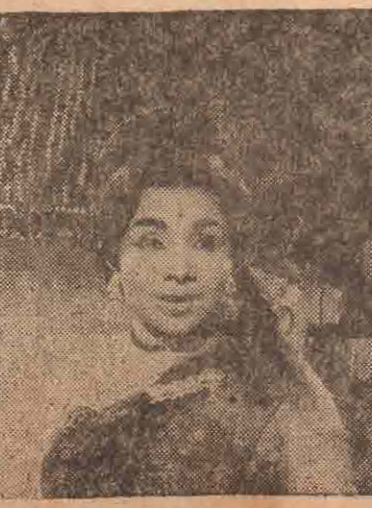
மனோமா இப்படி வருகிறார்

என் சினிமா வாழ்க்கை கவையாக இருந்தது. ரசிகர்கள்