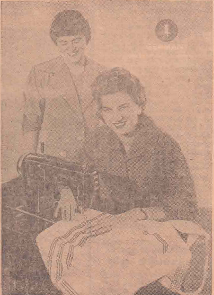
"HAID & NEU"