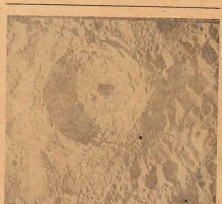
புதிக்கு தெரியாமல் மறைக்கப்பட்டிருக்கும் சத்திரவின் ஓர் பகுதியை மேலே பார்க்கிறீர்கள். இப்போது அதை அடையக்கூடிய வெளிக் கு அனுப்பி வைத்த ஓட்டர் 5 எடுத்து அனுப்பியுள்ளது.

திருமணத்துக்குப் பின்னரும் கணவன் தனது மனைவியைப் பெரிதும் மதிக்கவேண்டும். அவன் அவளைத் தாற்றி விட்டாலோ, அவ்வுது அவன் தன்னைக் கேவலப்படுத்திவிட்டதாக அப்பெண் கருதினாலோ அவள் தனது உடைகளைக் களைந்துவிட்டு, பிறந்த மேனியாய் சனது பெற்றோர்களிடம்