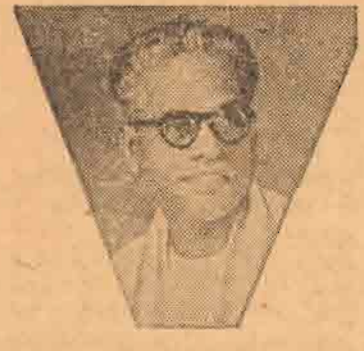
மதிப்பைக்கூடத் தமிழுக்குக் கொடுக்க மறுக்கின்றீர்கள்.

3. உங்கள் ஆணைக்குழுவின் கடித இறழ் முகப்பிலும் தமிழ் புறக்கணிக்கப்பட்டுள்ளது. ஏனைய திணைக்களங்களில் அமைச்சுக்களிடப்போலத் தமிழையும் உங்கள் கடித இறழ் முகப்பில் சேர்க்குமாறு பணிக்குக.