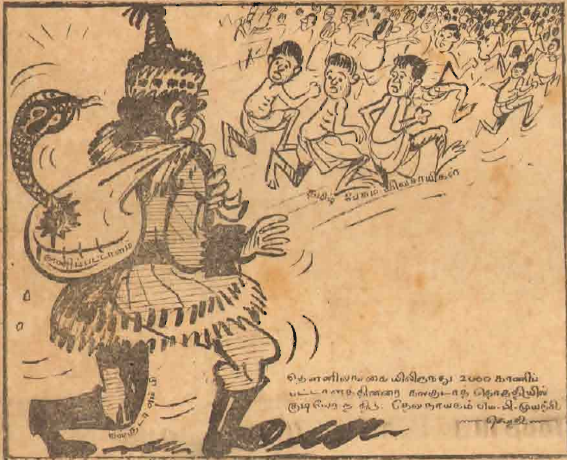
சிறீஸ்ரீமல தாத்தாவின் நத்தார் "பரிசு"