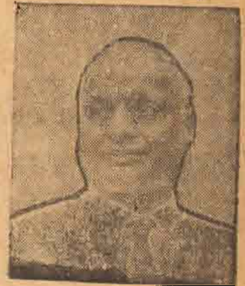
இலங்கைப் பிரஜாவுரிமை வழங்க வேண்டுமென்ற விருத்தம் ஒப்பந்தத்தில் கூறப்பட்டுள்ளது இங்கு குறிப்பிடத்தக்கது.

தமிழக வேட்பாளர்களை ஆதரித்து இம்மாதம் 13-ந் திகதி பரந்தவில் ஒரு பொதுக் கூட்டம் நடைபெறும் என்று தெரிகிறது.