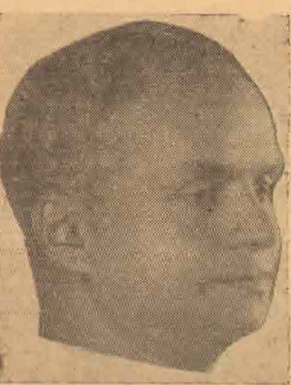
இருக்க வேண்டும் இத்தகைய வசதிகள் இல்லாத இடங்கள் அபிவிருத்தி அடைவதென்று மிகவும் கஷ்டமான காரியமாகும்.

“ஆறுகளும் வாடிகளும் உள்ள இடங்களில் சிறந்த பாலங்கள் அமைக்கப்பட்ட வேண்டும். பாலங்கள் அமைக்க முடியாத இடங்களில் நவீன இயந்திரப் படகு வசதிகளை ஏற்படுத்த வேண்டும். விவசாயத்திற்கு என்றால் எண்ணக்கத்தொழிலுக்கு என்றால் எண்ண மக்கள் தூரிதமாகவும் பாதுகாப்போடும் துறைகளைத் தாண்டிச் செல்ல வசதிகள்