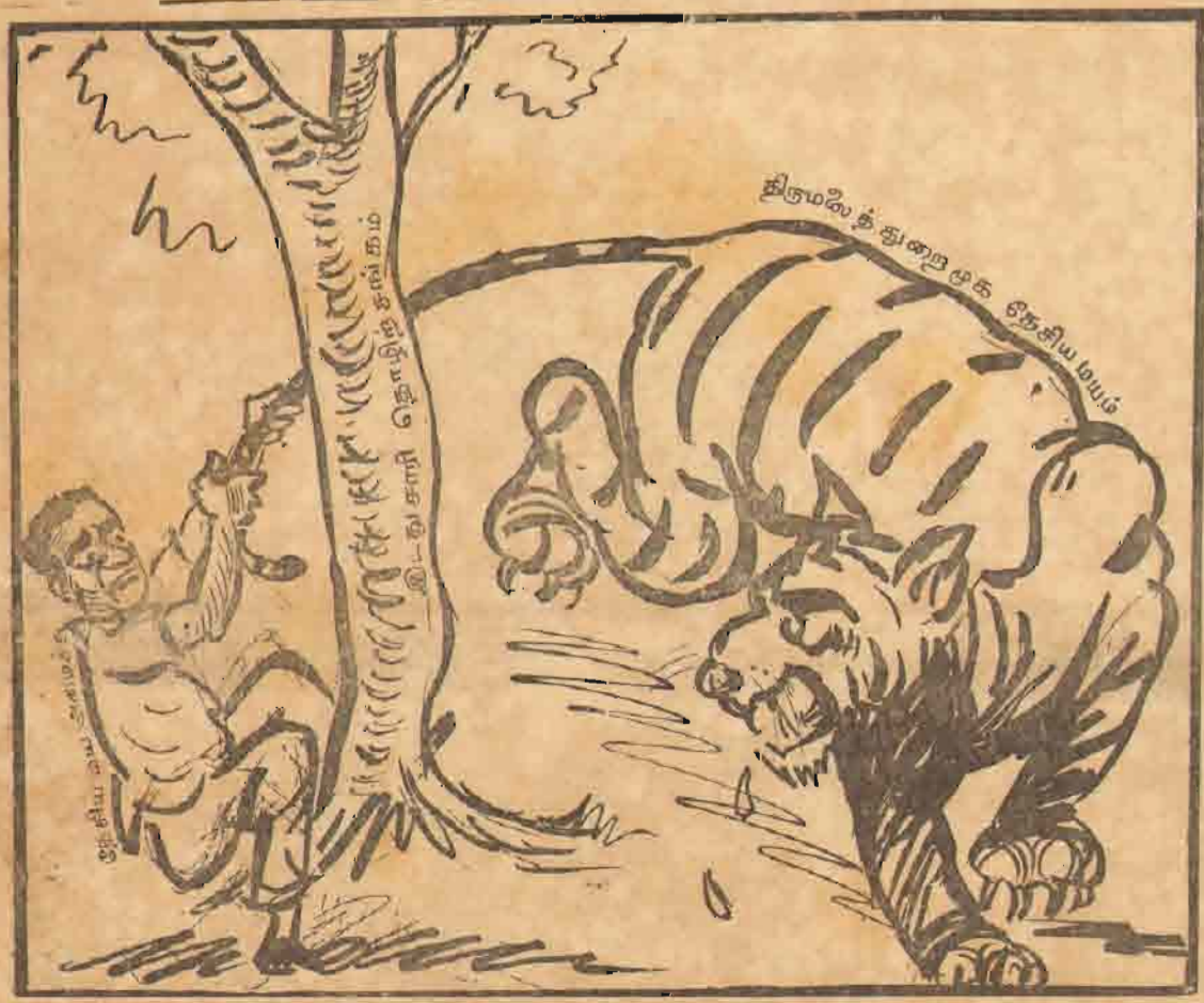
"புலி வாலைப் பிடித்திருக்கிறார்"

திருமலை மாவட்டம் ஏற்கனவே சிங்களக் குடி யேற்றத்துக்குப் பலியாகி யுள்ள பகுதி! அத்துடன் துறைமுகமும் சிங்களமய மாகால், தமிழ்பேசும் மக் களின் ஏதிர்காலம் இரு ளடைந்துவிடும்.