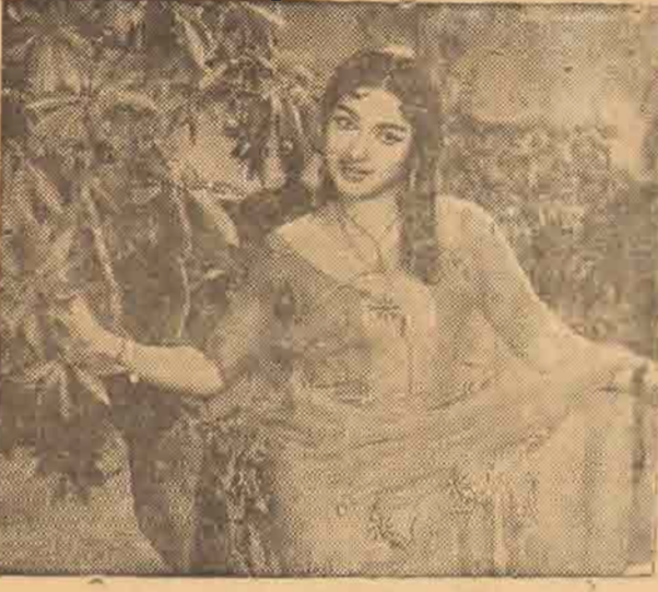
வேண்டும், புரையும் பெயரையும் சம்பாதிக்க வேண்டும். அவைகள் தாம் முக்கியம்.

கிடையவே கிடையாது பண்டிகை தினங்களில் தான். நான் நடத்த படங்களை வெளிவர வேண்டி மென்ற விருப்பம் எனக்குக் கிடையாது. என்று வெளிவந்தால் என்ன, படம் நன்றாக ஓட