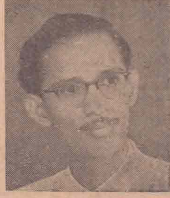
கல்முனை எம். இசட். மதுர் மௌலானா