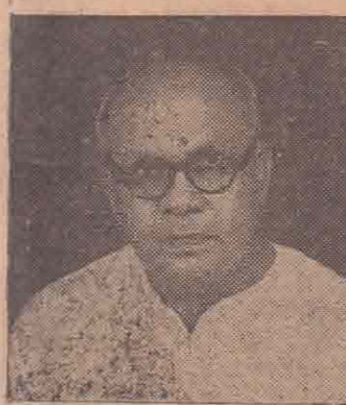
சுருக்கோணமலை சு. ரு. காணிக்கராசா