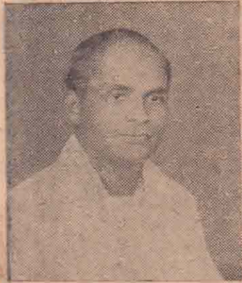
வட்டிருப்பு சி. நா. இராகவானிகாமம்

தாய்மொழியும் தமிழை அரியணையிலேற்றும் உறுதியான கொள்கையிலே உள்ளத்தில் தேக்கி தேர் தற்களம் நோக்கும் வீரகரின் பட்டியலை தமிழரசுக் கட்சி தேர்தற் குழு வெளியிட்டுள்ளது. தமிழ் பேசும் மக்களின் துயர் துடைக்கும் நோக்குடன் செயற்படும் ஒரே கட்சியான தமிழரசுக் கட்சியின் வேட்பாளர்களான இவ்வீரர்கள் அனைவரும் தேர்தற் களத்திலே வெற்றி வாகை சூடுவார்கள் என்பது நாடறிந்ததே.