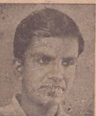
பருத்தித்துறை க. துரைத்தினம்