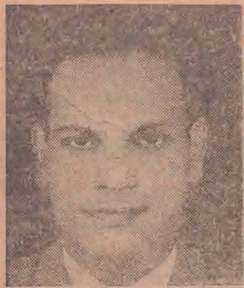
பொத்துவிள் எச். எஸ். காதர்