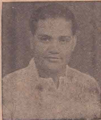
வட்டுக்கோட்டை அ. அமிர்தலிங்கம்