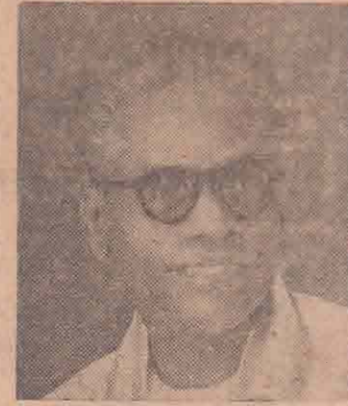
கிளிநொச்சி கா. பொ. இ. த்தினம்