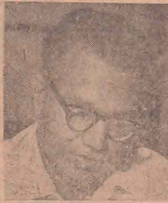
யாழ்ப்பாணம் சி. சே. மார்ட்டின்