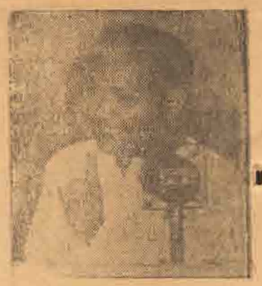
போராடிய தமட்டுமின்றி, ஒரு சமூக சீர்திருத்தவாதியாகவும் விளங்கினார். தீண்டாமையை ஒழிக்க அவர் எடுத்த முயற்சி என்றும் மறக்கமுடியாது.”