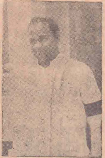
வன்னியர் எதிர்த்தார் ஜி. ஜி. ஆதரித்தார்

தேர்தல்களத்தில் விழ்ந்த திறந்த திரு. தம்பியப்பாவின் இடத்திற்கு வலுக்கட்டாயமாக இழுத்து வந்து நிறுத்தப்பட்டார் அப்போது அரசியலுக்குப் புதியவரான திரு. வன்னியசிங்கம். அவரைத் தமிழினத்துக்காக உழைக்கப்பாராளுமன்ற உறுப்பினராக்கியது கோப்பாய்த் தொகுதி.