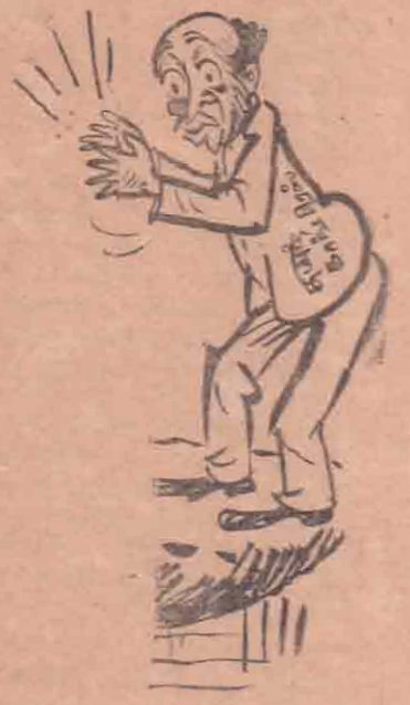
இவ்விரு மாகாணங்களில் தமிழை ஆட்சி மொழியாக்கவும்,

1956க்கு முன் சிங்கள ஏகாதிபத்தியத்துடன் சேர்ந்து தமிழினத்தை ஒழித்துக்கட்டும் நடவடிக்கைகளுக்கு ஆதரவளித்த தமிழ் காங்கிரஸ்—1956க்குப் பின் சிங்கள ஏகாதிபத்தியத்தை எதிர்த்து தமிழரசுக்கட்சி நடத்தும் போராட்டங்களையும் எடுக்கும் அரசியல் நடவடிக்கைகளையும் முறியடிப்பதில் ஈடுபட்டுவருகிறது; ஐந்தாம் படைப்பாக இயங்கிவருகிறது! வடக்கு கிழக்கு மாகாணங்களில் சிங்களக் குடியேற்றத்தை தடை செய்யவும், (9ம் பக்கம் பார்க்க)