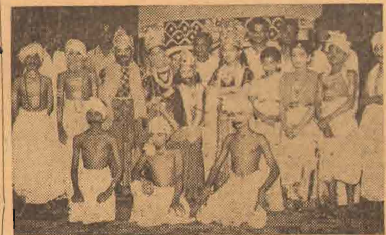
“செழியன் துறவு” என்ற நாடகத்தில் பங்குபற்றிய மாணவர்கள்.