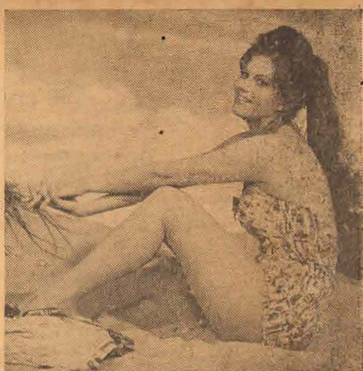
“நிர்வென்ற கடற் காற்று மெல்ல வந்து தேகத்தைத் தழுவும்போது, அடா சொல்லவும் வேண்டுமா, சொர்க்க பேசும் கிடைக்கிறது. பட்டு மணலிலே நீச்சலுடையில் இருந்து வெயில் குளிப்பது வெகுவாக குஷிதான். இந்த இன்பம் கிடைக்கும் என்று ஏங்குகிறீர்களா?” என்று கேட்கிறார் இந்த அழகு நடிக்க ஆங்கிலப் படக் காட்சி.