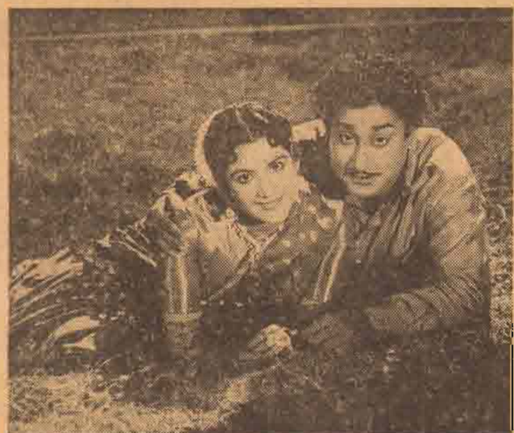
எட்ட இருந்தோம், ஏங்கினோம், கிட்ட வந்துவிட்டோம், கூடி விட்டோம். இனி ஏது கவலை இந்த வெட்ட வெளியில்? பாண்டி விளக்கு என்ற படத்தில் சிவாஜிகணேசனும் கமலாவும்.