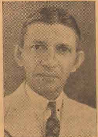
திரு. எஸ். ஜே. வி. செல்வநாயகம்

“ஒரு சர்வகட்சிப் பராமரிப்பு அரசாங்கம் (An All Party Caretaker Government) ஏற்பட லாக்கூட அதில் பதவியேற்கத் தமிழரசுக் கட்சி முன்வரமாட்டாது. எங்கள் இலட்சியம் சமஷ்டி அரசாங்கம் ஆகும். சமஷ்டி அரசாங்கம் ஏற்படும் வரை நாங்கள் எவரும் எந்தப் பதவியையும் ஏற்க மாட்டோம். சமஷ்டி அரசமைப்பு ஏற்படும் காலம் அதிக தூரத்திலில்லை” என்று தமிழரசுத் தந்தை திரு எஸ். ஜே. வி. செல்வநாயகம் சுதந்திரனுக்கு அளித்த ஒரு விசேஷ பேட்டியின் போது மிகுந்த உறுதிப்பாடுடன் கூறினார்.