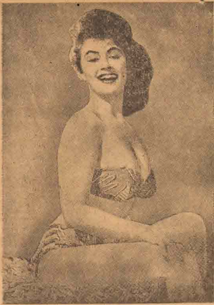
நட்சத்திரஸ்தானம் இனி நிச்சயம் இந்த வெள்ளை நடிக்கக் கூடிய அழகு ராணி என்று மேல் நாடிகளில் அறிபுகமானவர். பார்க்கதல் தெரிந்தால்லவா!