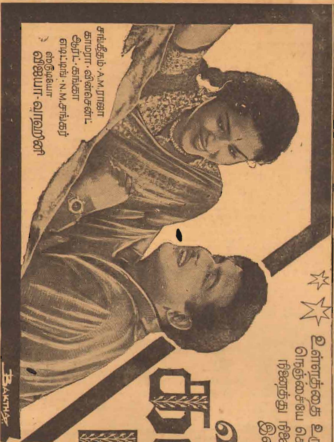
சங்கீதம் - A.M. ராஜா காமரா - வினசென்ட் ஆர்ட் - கங்கா எடிட்டிங் - N.M. சங்கர் ஸ்டூடியோ - விஜயா-வாஹினி

கிங்ஸ்லி பிளாஸா வெங்லிடன் விஜயா வெம்பிளி பூத்கிருஷ்ணா நியூசினிமா தீவொளி லக்ஷ்மி சரசாவி விஜிதா (கொழும்பு) (வெள்ளவத்தை) (யாழ்ப்பாணம்) (மட்டக்களப்பு) (கண்டி) (நெடுகொண்டை) (குருணாகல்) (துவரெலியா) (ரத்தினபுரி) (அக்கரப்பத்தளை) (மஸ்கேலியா)