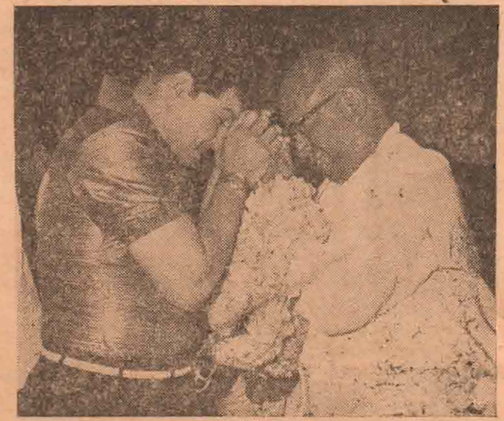
நெப்பியூன் ஸ்ரூடியோவில் நடைபெற்ற 'தெய்வத் தாய்' படப்பிடிப்பு ஆரம்ப விழாவுக்கு வருகை தந்த திரு. ஏ. வி. மெய்யப்பன் புரட்சி நடிகர் எம். ஜி. ஆர். அகமும் முகமும் மலர் வரவேற்கும் காட்சி.

ஆசிரியர், கலைப்பூஞ்சோலை, த. பெ. இலக்கம் 1183, கொழும்பு-12.