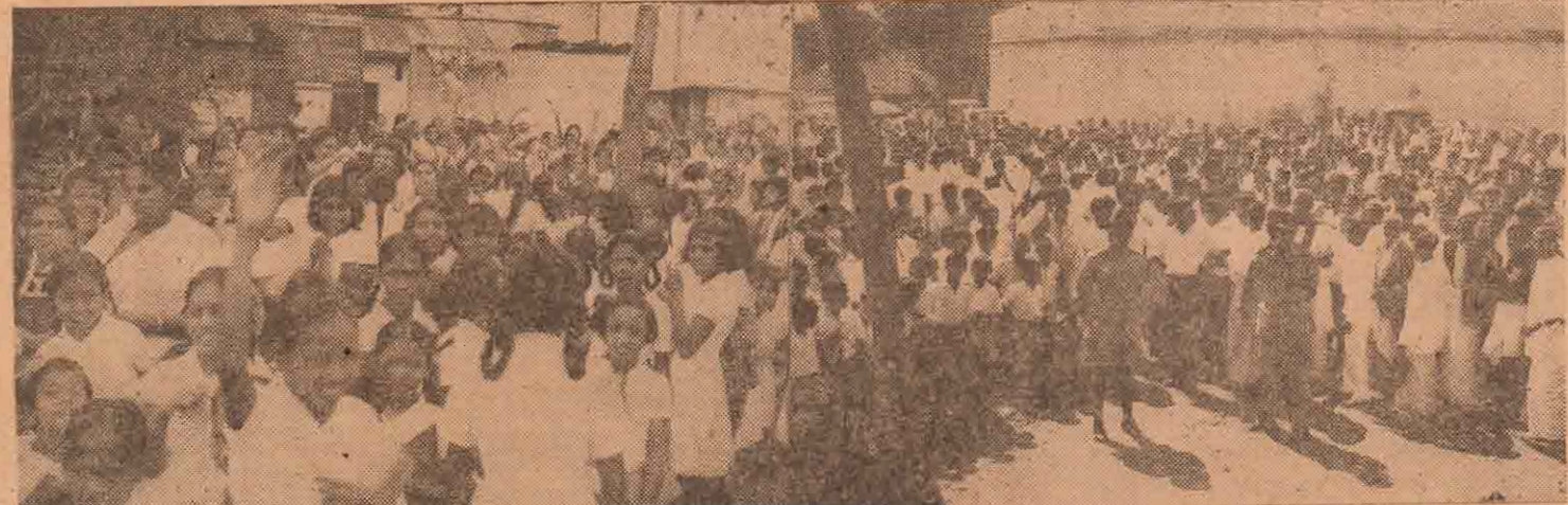
தமிழ்ப் பிள்ளைகளின் கல்வி வசதிகளை அபகரித்த பாடசாலைப் புனரமைப்புத் திட்டத்தை எதிர்த்து பதுனை புனித ஊர்கலாஸ் மாணவர்கள் ஆர்ப்பாட்டம் செய்துள்ளனர். புனரமைப்பை எதிர்த்து ஆர்ப்பாட்டம் செய்த மாணவர்களும், பெற்றோரின் ஒரு பகுதியினரும். (வலது)