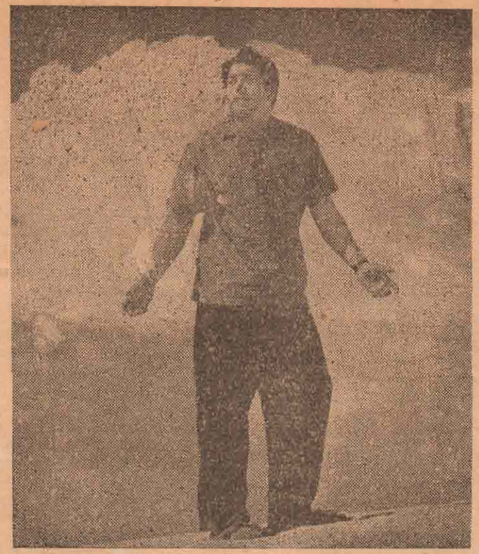
சினிமாஸ் திரைகளில் வெற்றிப் பலனி வந்து கொண்டிருக்கும் 'பார்த்தேன் பார்' படத்தின் மூலம் முத்துராமன் புகழ் வான் மூட்ட உயர்ந்து விட்டது போலும்.