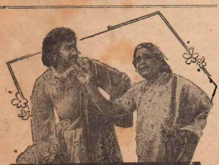
சிலோன் தியேட்டர்ஸ் திரைகளுக்கு விரைவில் வரவிருக்கும் 'மகாவி காசிதாஸ்' படத்தில் பத்தாறு கணைகளும், கே. பி. சுந்தரம்பாளையம்.

கே: தமிழ் நாட்டிலுள்ள சினிமா கொடகங்களை அரசாங்கம் ஏற்று நடத்துமென தி. மு. க. அரசாங்கம் கூறியுள்ளது. அப்படி செய்வது நல்லதா? கூடாதா?