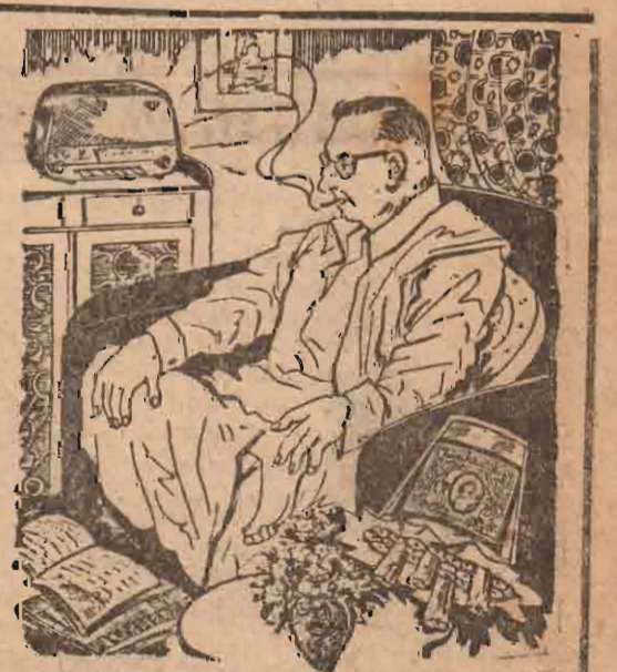
பணக்காரன் வரை எல்லோரும் புகைப்பது