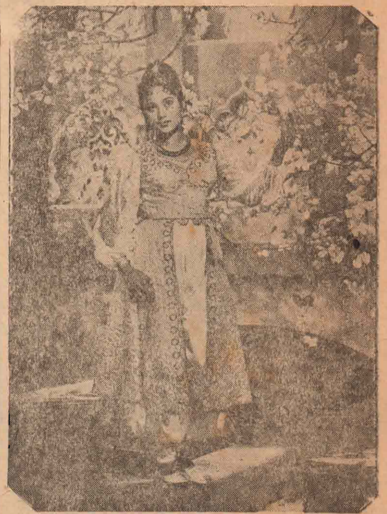
கொழும்பு கிரென்ஸ் படமாளிகையில் திரையிடக் காத்திருக்கும் இந்தியமான் 'அலடின்கின்பாத' இந்தி படத்தில் இந்த அழகியைக் காணலாம்.

சிறந்த பொழுதுபோக்குப் படம் 'இருவல்லவர்கள்' —மகேஸ்.