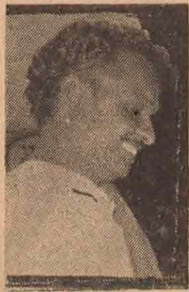
விருத்தி செய்வதிலும் அரசாங்கம் கவனஞ் செலுத்துகின்

இந்தப் பாராளுமன்றத்திலே பல வரவு செலவுத் திட்ட விவாதங்கள் நடைபெற்ற போது கிராமாந்தரக் குளங்களைத் திருத்த வேண்டியதன் அவசியத்தைப் பல அங்கத்தவர்களும் வற்புறுத்தியிருக்கிறார்கள். அவர்களில் ஒருவராக நானும் இருக்கின்றேன். விவசாயத் திட்டங்களிலே முன்னணியில் நிற்கின்ற கிழைத்தேசங்களை எடுத்துக்கொண்டால் அந்த நாடுகளிலே பெரிய நீர்ப்பாசனத்திட்டங்களிலே அரசாங்கம் கவனம் செலுத்துகின்றபொழுது சில கிராமியத் திட்டங்களை அபி