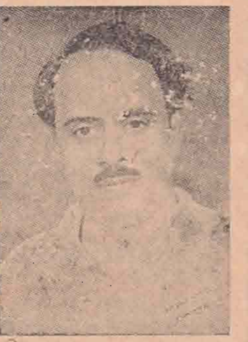
யாணத்தை முடித்துக் கொள்வார் என்பதும், அவரின் பிரயாணத்திட்டத்தில் இலங்கையும் அடங்கியுள்ளது என்பதும் குறிப்பிடத்தக்கதாகும்.

அறிஞர் அண்ணா உலக சுற்றுப் பிரயாணத்திற்கான அக்கூட்டிப் பத்திரத்தை (இண்டர் நாசனல் பாஸ்போர்ட்) ஏற்கனவே பெற்று விட்டார் என்பது குறிப்பிடத்தக்கது. எப்படியும் 1967ம் ஆண்டு இந்தியா பிராஸிஸ்டர் நடைபெறவிருக்கும் பொதுக் கேர்தலுக்க முன்னர் அறிஞர் அண்ணா உலகச் சுற்றுப் பிர