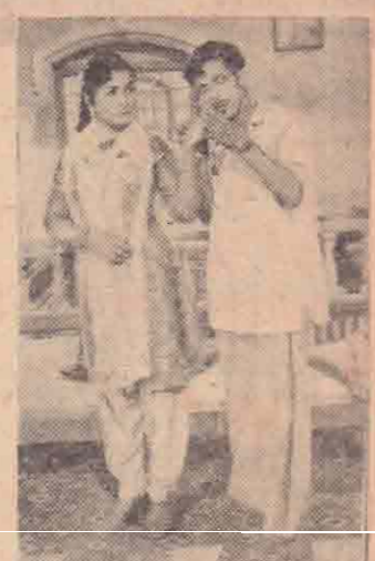
மனோமாவின் காதல் நாடியின் வேகத்தைக் கண்க்கொடுக்கிறபோது நாகேஷ். எதற்கும், சிவோன் என்ற டிரெயின் மெண்டல் திரைகளுக்கு வரவிருக்கும் ஏ. எல். எஸ். சாரிஸ் 'சாந்தி' விடைகூறும்.

சிறுவர்களுக்கென தனி சுவாக முன்றும்னி நேர நாடகம் எதுவும் இதுவரை தமிழில் நடைபெற்றதில்லை. இப்புதிய முயற்சியில் பிரபல நாடகக் கலைஞர்களான டி. கே. எஸ். சகோதாரர்கள் துணிந்து இறங்கியிருக்கிறார்கள். இவர்களின் புதிய முயற்சியான 'அப்பாவின் ஆசை' என்னும் சிறுவர் நாடகம் சென்னை திருவல்லிக்கேணி கலா மண்டப அரங்கில் தமிழ்நாடு சங்கீத நாடக சங்கத்தின் சார்பில் நடைபெற்றது.