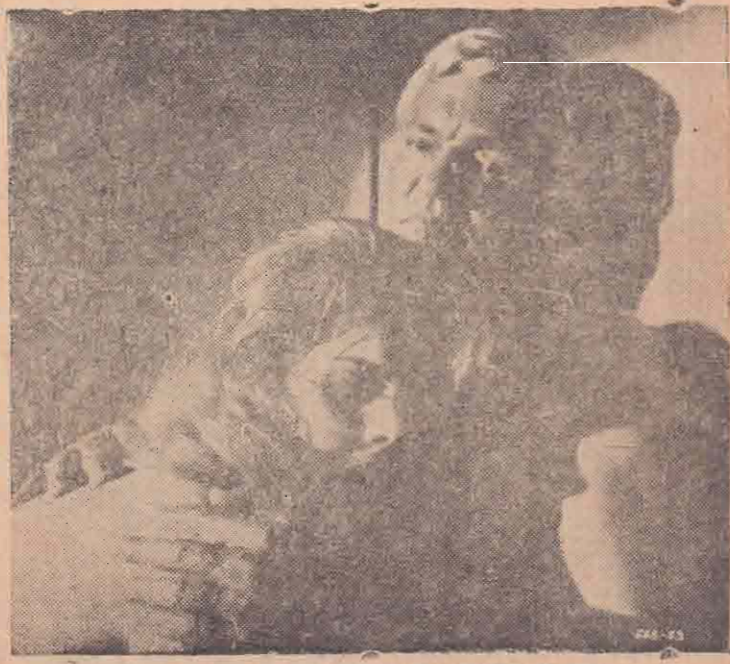
கொழும்பு பாமன்கடை இரோஸ் சினிமாவில் விரைவில் திரையிடப்படவிருக்கும் 'ஸ்டேஷன் சிக்ஸ் சகாரா' என்ற அங்கிலப்படத்தில் சுரோஸ்பேக்கரும் பீட்டர் வான்விக்கும் தோன்றும் உணர்ச்சிகரமான கட்டம்.

திருடக்கூடாது, பிச்சை எடுக்கக் கூடாது, சோம் பேறியாய் வாழ்க்கூடாது, உழைத்துப் பிழைத்து உபரவேண்டும் என்ற உயர்ந்த இலட்சியங்களைப் சபாதிக்கும் இந்த 'அப்பாவின் ஆசை' நாடகம் தயிழ் சங்கீத நாடகச் சங்கத்தாரின் நாடகப் போட்டியில் தேர்ந்தெடுக்கப்பட்டு முவாயிரம் ரூபாய் பரிசைப் பெற்ற குழந்தைகள் நாடகம் என்பது குறிப்பிடத்தக்கது.