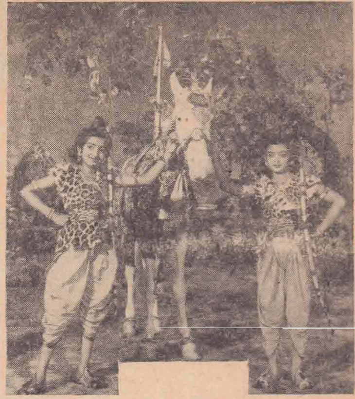
தென்னகத்தில் 15 நகரங்களில் தொடர்ந்து 25 வாரங்கள் ஓடி வெற்றிக்கொடி நாட்டிய பலவாணச் சித்திரமான 'லவகுசா'வில், இப்படம் சினிமாஸ் திரைகளுக்கு விரைவில் வருகிறது.

தெய்வீக நெறியைப் பரப்பல்வாண்டுகள்மேற்கு நாடுகளில் பிரயாணம் செய்த சுவாமிஜி, சிவானந்தாஜியின் மகா சமாதிக்குப்பின்னர் உலக திவ்ய ஜீவன சங்கங்களுக்கெல்லாம் தலைவராகி, ஞான ஒளி பரப்புகின்றார். இலங்கையில் அவர் பாதம் பட்ட இடங்கள் எல்லாம் புனிதமடைகின்றன.