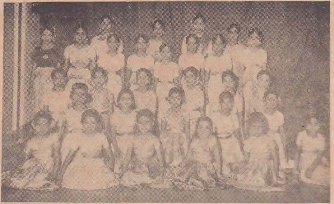
கடந்த 9, 10ம் திகதிகளில் கொழும்பு விவேகானந்த வித்தியாலய மண்டபத்தில் கொழும்பு விவேகானந்த நடன மன்ற ஆதரவில் நடைபெற்ற நடன விழாவில் நடனமாடிய நடன மன்ற மாணவிகள்.

இந்நாடகத்துடன் விண்ணொளி நாடக மன்றத்தினர் முற்றிலும் பெண்களைக் கொண்ட தயாரித்துள்ள ஒரு சமூக நாடகமும், மட்டுமல்லாமல் ஆனந்தனின் ஒரு கதைச்சுவை நாடகமும் இடம்பெறுகிறது.