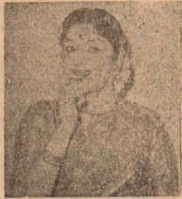
சக்தி கிருஷ்ணசாமி எழுதுகிறார்.

சுல்ட்மென் கலரில் தயாராகப்போகும் 'கல்வி'யின் 'பொன்னியின் செல்வன்' திரைக்கலை வகைத்தை