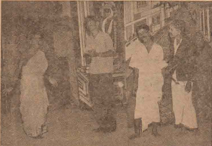
யாழ்ப்பாணம் இந்துக் கல்லூரி சரித்திர குடிமையிற் கழகம் நடத்திய 'ஆவது பெண்ணை' என்னும் நாடகத்தில் இரு காட்சிகள்.

1959ம் ஆண்டு சென்னையில் நகரசபைத் தேர்தல் ஜூரத்தின் வேகம் மிகக் கோரமாக ஏறிக்கொண்டிருந்தது. சிலவாரங்களுக்கு முன்பாகத்தான் சிவாஜி கணேசன் வடநாடு சென்று திரும்பியிருந்தார். ஒருகூட்டத்தில் பேசும் போது, 'கலைத்துறையில் தெற்கு வளர்ந்துள்ளது வடக்குத் தேய்கிறது' என்று கூறினார். அடுத்த