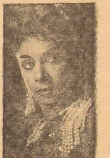
கொலுப்பு கிரவுண் படமானிசையில் திரையிடப்பட்டுள்ள இத்திபேகம், ஈஸ்ட்மென் வர்ணப்படமான 'நாக கன்னி யில்' (கோப்பா கேள்) ராகினி இப்படித் தோன்றுகிறார்.